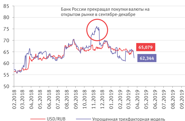
Минфин вновь смотрит в сторону укрепления курса рубля